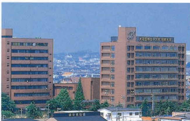
大和田キャンパス

本学園は4月1日から学校法人名を「大阪国際学園」に変更、60有余年の「帝国学園」に別れを告げ、まったく新たなスタートを切った。この学報も新しい学園、大学を中心とする各校や学生・生徒、教職員の清新な動き、思いを学園内外に伝えようと、装いを新たに創刊した。