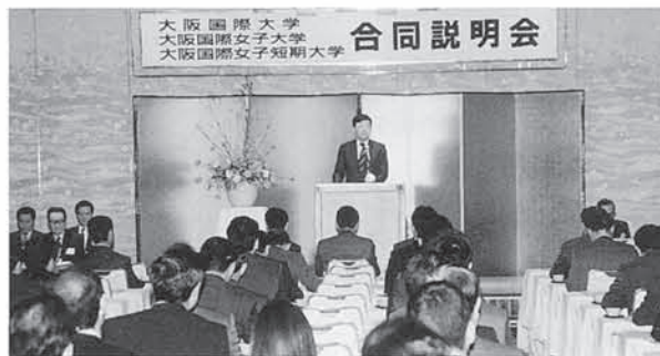
大阪国際大学、大阪国際女子大学、大阪国際女子短期大学の合同説明会に続き、「3