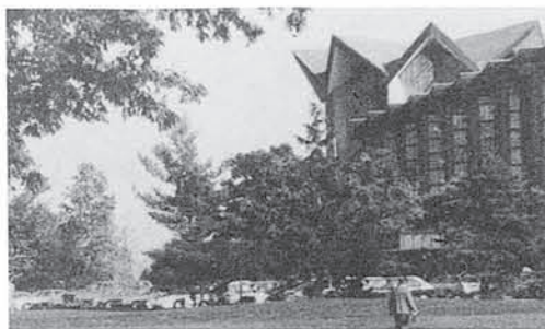
バルパライソ大学キャンパス

平成5年度の外国人特別科目等履修生11人(全員オーストラリア学生)が3月末に来日。この4月より12月までの9ヶ月間、女子大・短大で日本語をはじめ日本の社会、文化等について日本人学生とともに学ぶ。