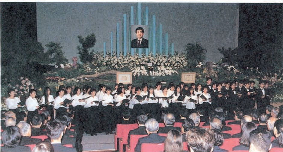
花と緑に埋め尽くされた祭壇の前で、大学・高校・中学の学生・生徒が合唱した

ほかに生花や根つき樹木などなどで飾られた。多数の参列者を想定して第2(イベントホール)第3(プラウジングルーム)の会場も