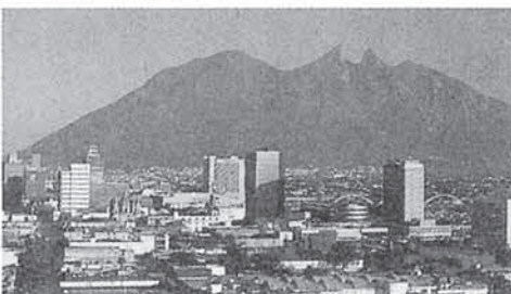
メキシコ州まで車で2時間。高い山々に囲まれたモンテレー市は、様々な顔を持つ

なり恵まれた学習環境にある。モンテレー工科大学はメキシコではかなり名門であるが、日本では度々早稲田大学の様に政界や実業界に数多くのOBを送り出しており、国内での影響力はかなり高いようで、前述した学内施設の充実の高さも納得できることである。同大学の授業料は他大学に比べて結構高いという事で、比較的裕福な家庭の子息が多く、下町っぽい街から一步学内に入ると一種別世界の様な印象を受ける。