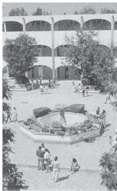
にぎやかな下町から一転、学内はハイテク駆使の恵まれた学習環境で、エリート達を輩出する