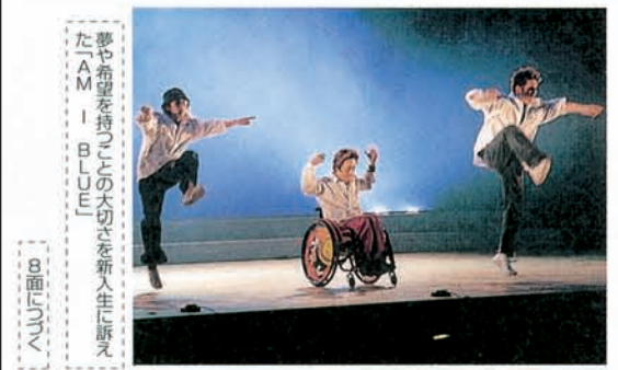
夢や希望を持つことの大切さを新入生に訴えたAM I BLUE

『The First Scene』 「新入生たちに夢と勇気を持つことの大切さを伝えたい」とこんな想いから学園にとつて初めての試みである新入生歓迎プログラム『The First Scene』は生まれた。4月7日、大阪国際会議場において、短期大学部入学式に続く形で、短期大学部、滝井高校、大和田高校、大和田中学校の新入生、保護者、大和田幼稚園の新入園児の保護者を加えて、新入生の部と保護者の部の2会場に分かれて実施された。新入生の部は、各学校の合同吹奏楽部による演奏からスタートし、これに各学校の在校生によるコーラスが加わった「翼をください」の演奏後には、会場に割れんばかりの拍手が沸き起こった。この他、マスコットキャラクターの紹介や学園紹介ビデオ「探しても何ですか?」の上映が続ぎ、劇団フアントマと車椅子ダンサー「奈佐誠司氏による演劇『AM I BLUE』では、夢や希望を持つことの大切さが伝えられた。また、保護者の部では、作曲家、歌手のタケカワユキヒデ氏による「思春期は終わらない」と題する講演会を実施。思春期の子どもたちとその親との関わりについて考える機会を持つとともに、奥田理事長、平岡理事からは今後の学園の取り組みについて保護者に理解と協力を求めた。