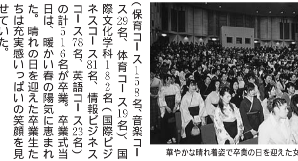
華やかな晴れ着姿で卒業の日を迎えた女子大学生たち

大和幼稚園の第37回保育修了証書授与式は3月19日(水)午前10時から、奥田メモリアルホールで行われ、60名の園児が卒業した。園長は「園児が卒園して流石と感動しているのだから、私も感動しています。これからも、先生や職員の人たちと一緒になって、自分自身の未来を切り開いてください。決して負けないでください。決してあきらめないでください。もしつらいことがあったらこの学校に来てください。10年後でも20年後でもここにいらつしやる先生、職員、受付、食堂の人たちが多くは白髪は増えているでしょうが、皆さんにとってこの学校はどのよう存在だったでしょうか。きっといろいろなことがあつたでしょう。楽しいことも、つらいことも、頭にきたこともあつたかもしれませんが、悲しみに包まれたこともあつたのではないのでしょうか。一人ひとりが様々な思いを持って、この学び舎を後にして、これからいろいろな道に進まれることと思います。私は皆さんの思い出がいつばい詰まったこの学校を、