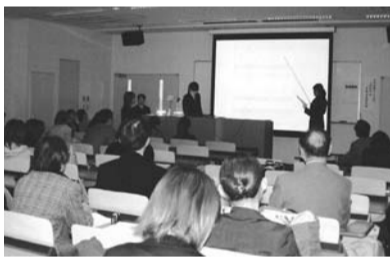
商店・連合会役職者らも聴講された女子大社会コミュニケーション学科の卒業研究発表会

の現状」と題し、大学のある地元商店街のひとつを調査、商店街関係者らと意見交換をしながら活性化に向けた提案を行った。