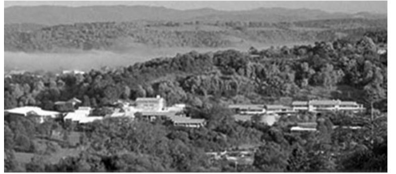
恵まれた景観の中、先進的な国際大学を目指すサザンクロス大学