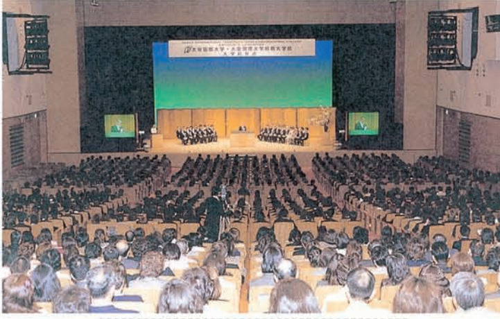
大阪国際会議場メインホールを満席にして開催された入学式

新生・大阪国際大学のスタートを期して4月7日(日)、大学3学部、大学院、留学生別科と短期大学部の入学式が大阪市北区・大阪国際会議場のメインホールを舞台に行われた。学生総数約1900名。また、この日のために教職員有志による委員会が策を練って1年間準備を進めた歓迎イベント「学園新入生歓迎プログラム『The First Scene』」が多彩にくり広げられ、参加者は学生・生徒約2500名、保護者約2000名。広い大会議場はこの日、学園のイベントで彩られ、新生・学園の前途を祝福する様相だった。