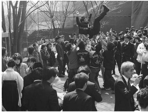
後輩たちに胸上げて祝福される卒業生(国際大)

大阪国際大学の卒業証書・学位記授与式は3月25日(月)大講義室で行われた。大学院経営情報学研究所博士課程2名・修士課程11名、大学院総合社会科学研究所8名、経営情報学部278名、政経学部187名、計486名が卒業。式は学部別に行われ、午前10時から大学院経営情報学研究所、経営情報学部、続いて午前11時30分から大学院総合社会科学研究所、政経学部金子敦郎学長が各学科・専攻の代表者に卒業証書・学位記が授与した後、式辞を述べた。学歌「新鮮な旅人」を斉唱して閉式した。また、夕方には学友会主催で卒業記念パーティーがホールニューオータニで開催され、イベントなどで学生・教職員一同になって盛り上がった。