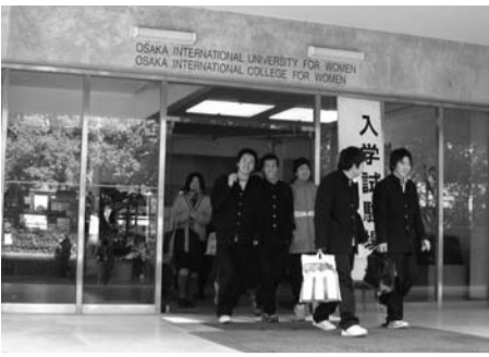
男子受験生を初めて迎えた守口キャンパス入試

の統一した時期方法で実施した。予算の許す限り、有効なあらゆる媒体を利用し、各地での大学説明会や学校訪問を通じ、新生「大阪国際大学」をPRしてきた。特に、人間科学部の社会科学コミュニケーション学科を心理コミュニケーション学科に改名したことで、スポーツ行動学を