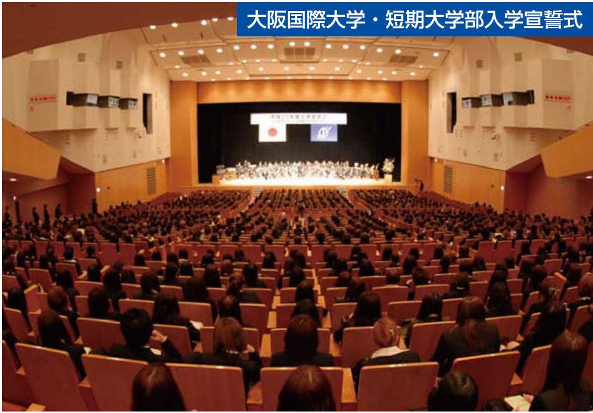
大阪国際会議場のメインホールに守口・枚方両キャンパスの新生と教職員が一同に会し、気持ちを締めスタートを切った