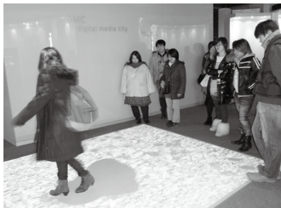
デジタルメディアシティ内、歩くその床の足跡部分に花が咲く展示

「また行きたい」「もっと日数が欲しかった」という感想が何人もからあがっており、色々と感があったのではないかと聞かれます。参加学生には、日本が進んでいる点、遅れている点を意識して今後の社会の発展に寄与することを期待しています。今後は隔年での開催を計画しています。