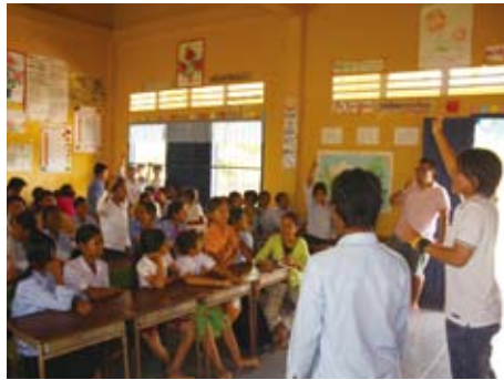
カンボジアボランティアワークキャンプの一コマ。研修での体験をきっかけに、自分のすべきことに目覚める学生も多い(大学・短大)

大学生は、英語研修のほか、ボランティア研修、ワークキャンプ研修、海外事情研修、日本語支援アシスト研修など海外提携校へ短期、長期の留学をし、基金から奨学金を受けている。人数は年