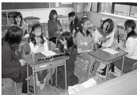
「上手に吹けてるよ。地域の小学生にやさしく指導する部員たち」

最初はこわごわ楽器を触っていましたが、合奏前にはそれぞれちゃんと音が出るようになってきました。最後には全員で集まって合奏をしました。「テキーラ」という曲の中のかげ声の練習も中高生と一緒に大きな声で挑戦し、合奏は盛り上がりました。最後に、曲を通して演奏して、音楽教室を終えました。小学生は皆「とても楽しかった」