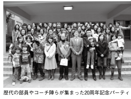
歴代の部員やコーチ陣らが集まった20周年記念パーティ

回全日本学生選手権大会では準優勝し、全日本選手権大会ベスト4という成績を残すクラブへ