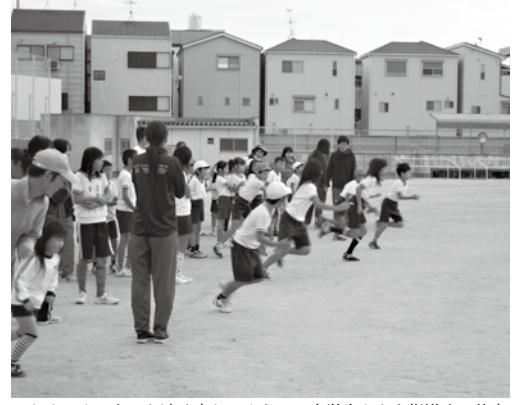
これまでよりもっと速く走れるように、小学生たちを指導する体育会の学生たち