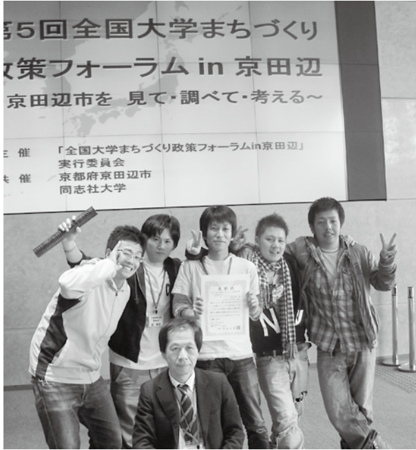
成果が実って喜びあふれるプロジェクトメンバーたち

毎年、春(京都府京田辺市)と夏(北海道登別市)に開催されている「政策フォーラム」は、全国から学生・院生が集まり、まちづくりについての解決策を考えていく企画で、他大学(院)の活動や研究も知ることができ、とても有意義な場となっている。われわれのチームは今回で3回目の参加だったが、政策提案