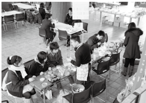
様々なプログラムを体験し、在学生や教職員と情報交換もできるオープンキャンパス

3月26日に守口キャンパスで新3年生や新2年生を対象に、「春のオープンキャンパス」を開催しました。当日は3月下旬とは思えない寒さの中、東は千葉県から西は高知県まで高校生160人が来場してくれました。