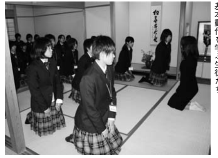
日本文化室で、「立つ」「座る」の美しい基本動作を学ぶ生徒たち