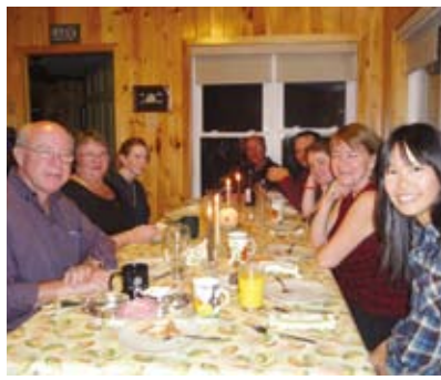
カナダのホームステイ先で。人々との交流から生徒たちは多くを学んで帰国する(滝井高校)

度によって変動があるが、ここ10年の多い年で1300人、少ない年で60人となっている。 大和高校からはオーストラリアへ毎年4人、滝井高校からはオーストラリアとカナダの提携校に毎年6人が3週間から5週間の語学留学をしている。