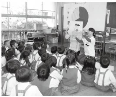
幼稚園で食育活動の様子

【朝ごはんの大切さ】や、「食べ物」の栄養について、「旬の食べ物」、「おせちの由来」など、毎回子ども達は楽しんで話を聞