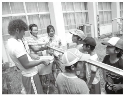
廃校を活用した交流センターで、流しそ うめんを楽しむ地元小学生と学生たち

この企画をするにあたって大 変だったことは、まず開催日を 決めることでした。高校によっ て期末テストの日程が違って いて、どの日に開催するのかが何 度も高校に直接確認を取りに行 きました。