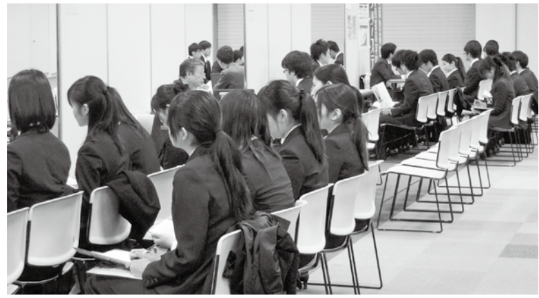
学生と企業を結びつける、本学主催の毎年恒例の「企業セミナー」。“就活”に真剣にのぞむ学生たち。会場は熱気に包まれていた

ラス4.4%となり、短大では94.8%で、前年度とほぼ同じ高い水準となりました。