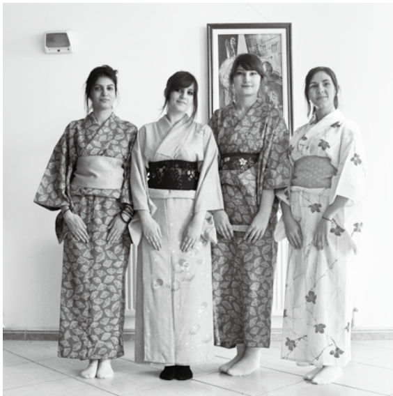
ルーマニアのデイミトリエ・カンテミール大学の日本祭で、踊りに参加した学生たち