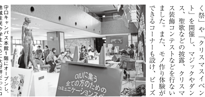
守口キャンパス本館1階にオープンし、 地域住民や学生たちに好評だったコ ミュニケーションスペース