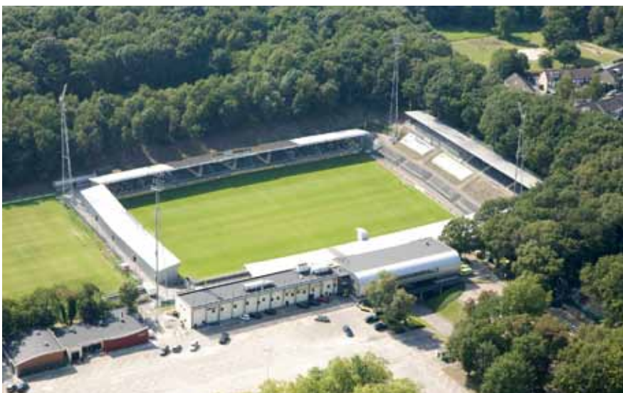
VVVフェンロのスタジアム。現地に滞在してスポーツビジネスを学ぶ貴重な機会だ