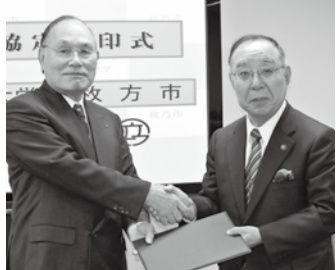
枚方市と国際大は、2月18日、枚方市役所で、枚方市の地

また、守口市・門真市の自治体や守口門真商工会議所、商店街などの商業連盟との協働した