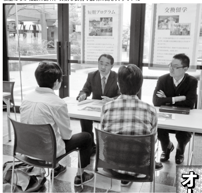
海外に真剣にチャレンジするための様々なプログラムを紹介する国際交流のブース。高校生たちが相談に訪れ、真剣な表情で説明に聞き入っていた