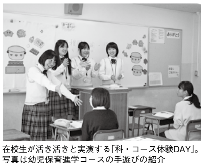
在校生が活き活きと実演する「科・コース体験DAY」。写真は幼児保育進学コースの手遊びの紹介

入試のポイントやプレテスト体験も 今年度の大和田中学の募集関係行事は、7月20日の「オープ