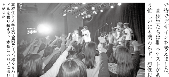
高校生と大学生の合同ライブ。様々なハ ンドルを乗り越えて、本番はおおいに盛り 上がった

大阪国際大学の軽音楽部、 フォークソング部、牧野高校の 軽音楽部、枚方高校のフォーク ソング部が参加しました。 ライブハウスの都合で直前に 開催日を変更しなければならな いというアクシデントがありま したが、無事にこの企画を行う ことができました。事前に何回 も高校生スタッフとミーティン グをしていたので、絶対この企 画を成功させようという同じ気持 ちを持って当日を迎えることが できました。