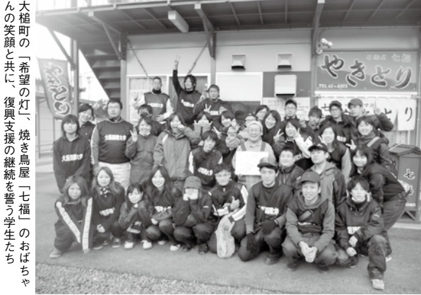
大槌町の「希望の灯」・焼き鳥屋「七福」のおばちゃんらの笑顔と共に、復興支援の継続を誓う学生たち