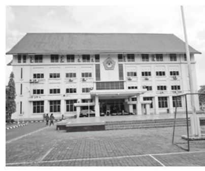
インドネシアの新たな協定校、ダルマ・ブルサダ大学

インドネシアの4大学は、日本語学科のある大学、授業がインドネシア語だけでなく、英語でも行われている大学など、何れの大学も広く海外へと視野を広げ、学生の海外派遣や海外からの学生受入れにも積極的な国際的な大学です。London School of Public Relations Jakartaではネイティブスピーカーの教員が英語集中コースを担当し、学生の英語力を補強。学部の講義を英語で受講できるだけの力をつけ、グローバルな人材を育成しています。