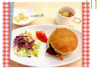
守口キャンパスある日の朝メニュー

食堂1F 8:00~10:00 和定食・洋定食(日替わり) 300円 朝カレー 310円