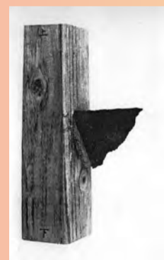
割れたガラスが突き刺さった柱。当時の風の強さを何よりも雄弁に物語っている。

「室戸台風」という名前は高知の室戸岬にちなむものですが、実はこの台風は上陸地である室戸よりも、むしろ大阪に凄まじい被害をもたらしました。特に、守口・門真では小学校の校舎が強風により、倒壊・半壊し、多くの学童が犠牲となっています。本展では、この歴史的事実を重く受け止め、写真や経験者へのインタビュー、市内に今も残る慰霊碑などによって、当時の状況を振り返ります。